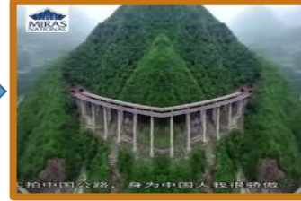
بيكين - الصين