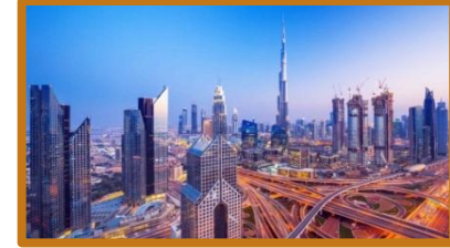
دبي - الامارات

إجابات المطور المسبقة لبعض من يهابوا تمويلات المشاريع العملاقة