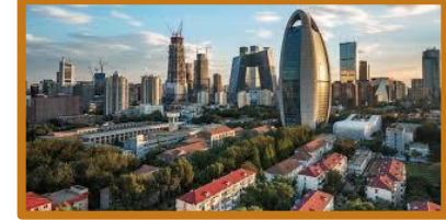
لاس فيغاس - امريكا